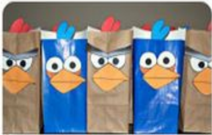
Petits sacs à surprise cadeau